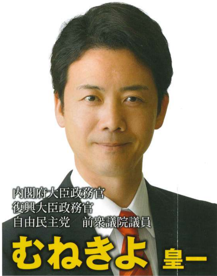
内閣府大臣政務官 復興大臣政務官 自由民主党 前衆議院議員