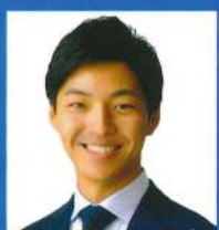
大阪府議会議員 塩川 憲史