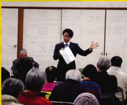
■市内各地で国政報告会を開催