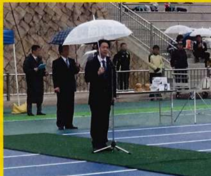
■東大阪市中学生ラグビーフットボール大会。協会会長として挨拶