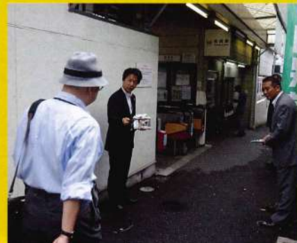
■市内各駅頭で政策機関紙を配布