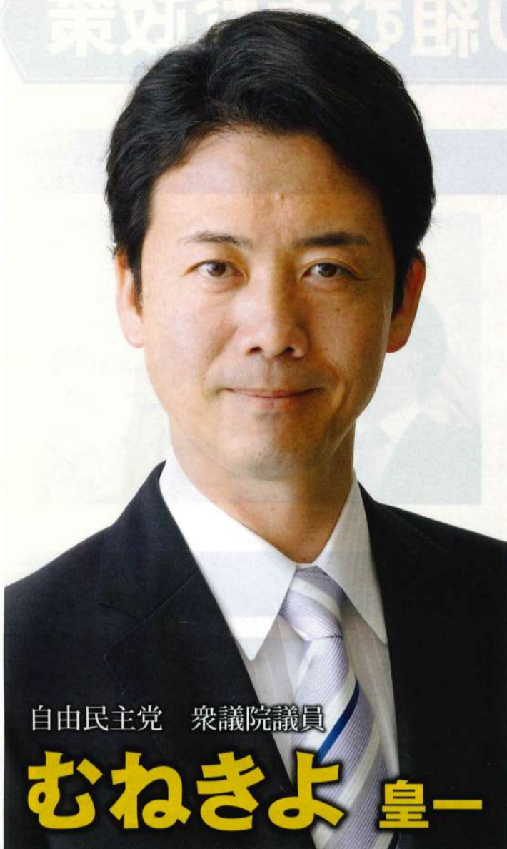
自由民主党 衆議院議員

この素晴らしい日本、大阪を将来世代に引き継いでいくための責任を果たして参ることをお誓い申し上げてご挨拶とさせていただきます。