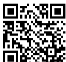
個別接種が できる医療機関