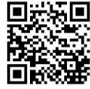
東大阪市 ホームページ

会場： ・旧東部地域仮設庁舎 東大阪市南四条町 1-1 ・花園ラグビー場 東大阪市松原南 1-1-1 ・ヴェル・ノール布施 東大阪市長堂 1-8-37 ・東大阪市役所本庁舎 東大阪市荒本北 1-1-1