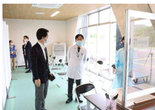
コロナワクチン集団接種会場の視察