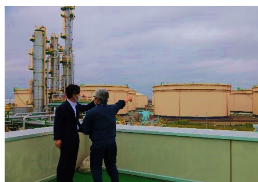
CO2回収・貯蓄施設の視察