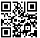
大阪府コロナワクチン 接種センター

*接種会場（モデルナ製とファイザー製）によって接種を受けることができる年齢が異なりますのでご注意ください。