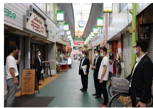
東大阪で活躍されている企業訪問